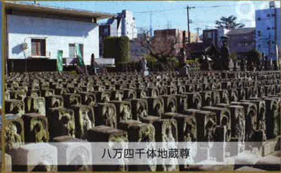
八万四千体地藏尊