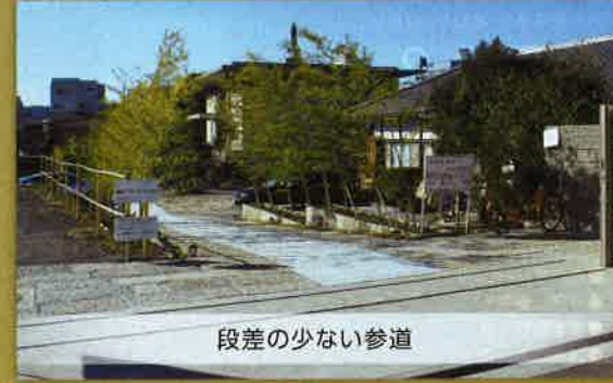
段差の少ない参道