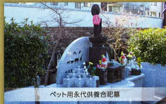
ペット用永代供養合祀墓