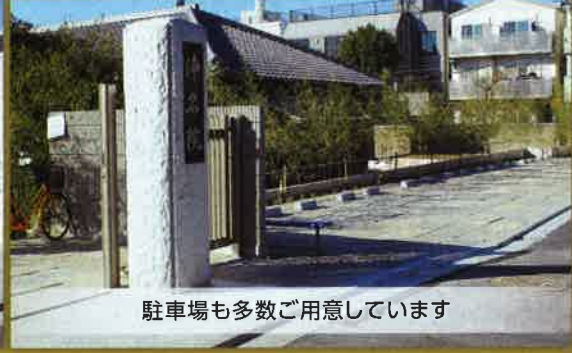
駐車場も多数ご用意しています